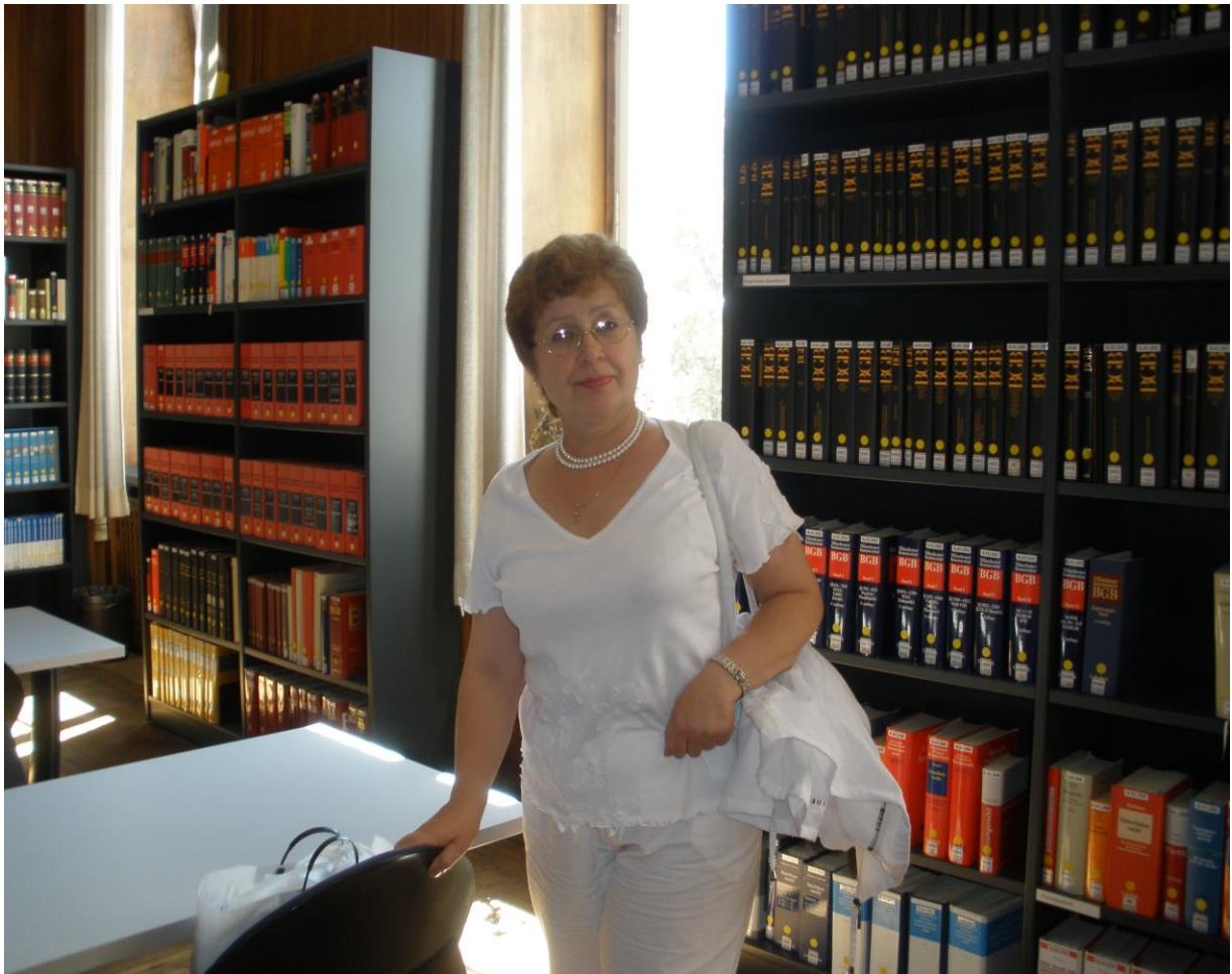
Поїздка до Німеччини для ознайомлення з розвитком бібліотечної справи у рамках співпраці з Гете-Інститутом. м. Берлін, липень–серпень 2009 р.